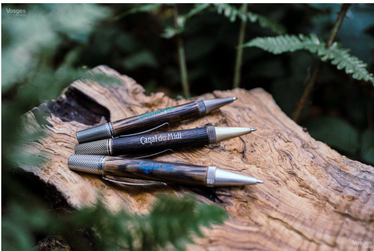
Près de 26.000 platanes malades ont dû être abattus le long du canal du Midi. Pour contribuer à la replantation, la marque ardennaise Thilleon va créer 30 stylos-billes exclusifs sur dix ans.