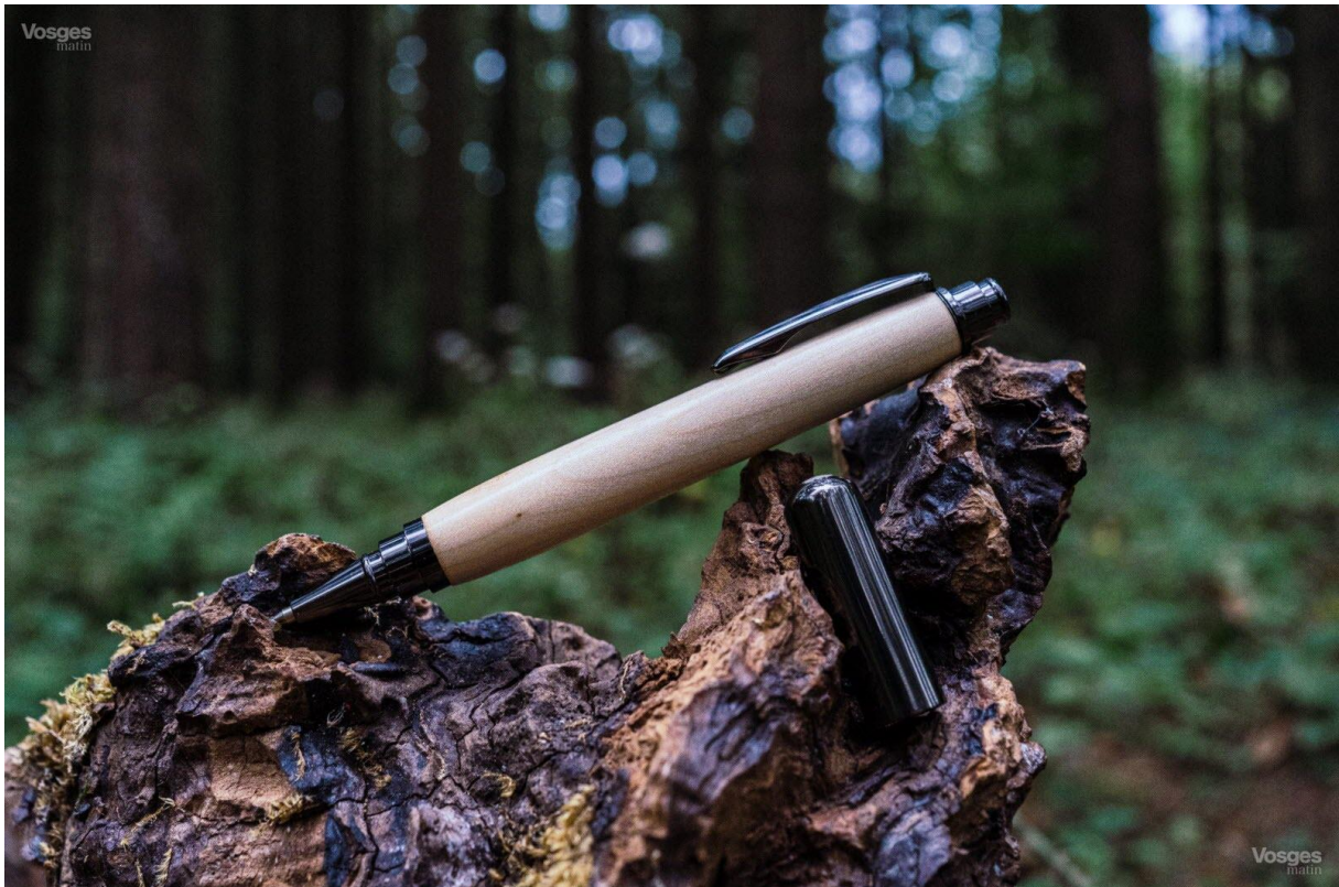
Chaque stylo Riquet fera référence à un lieu, un personnage ou un ouvrage d'art emblématiques du canal du Midi.