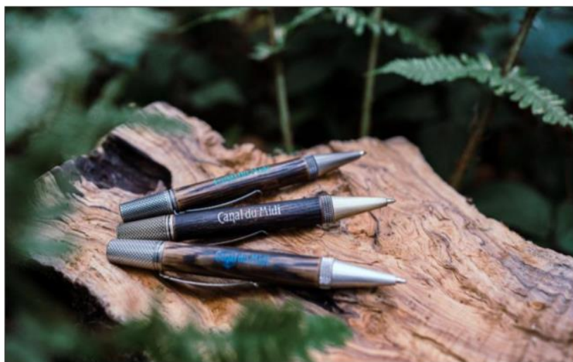
Près de 26.000 platanes malades ont dû être abattus le long du canal du Midi. Pour contribuer à la replantation, la marque ardennaise Thilleon va créer 30 stylos-billes exclusifs sur dix ans.

Le canal du Midi, qui relie Toulouse à la mer Méditerranée, soit 240 km, est en effet confronté à une épidémie de chancre coloré qui menace sa voûte arborée. 26.000 platanes ont dû être coupés pour stopper la propagation de ce champignon microscopique. 12.000 ont été replantés, des berges rénovées et 900 nichoirs installés par l'intermédiaire de la mission mécénat de VNF. Depuis 2013, elle multiplie les actions de sensibilisation et de collecte de fonds : pique-nique avec de grands chefs, partenariat avec le fabricant de décoration vintage Marcel Travel Posters, etc. Et, désormais, Thilleon. Pour ce faire, le jeune artisan de Monthermé a imaginé une gamme de stylos nommés Riquet. Ils seront conçus en bois d'érable, de