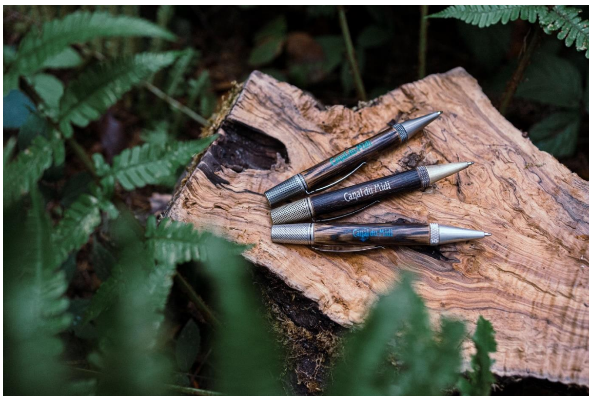
Les stylos "Riquet" serviront à financer la replantation du canal du midi

La fabrique de stylos-billes ardennaise Thilleon propose, en partenariat avec la Mission Mécénat des Voies navigables de France (VNF), une gamme de stylos exclusifs en hommage à Pierre-Paul Riquet. 15 % des recettes serviront à financer la replantation du canal du midi.