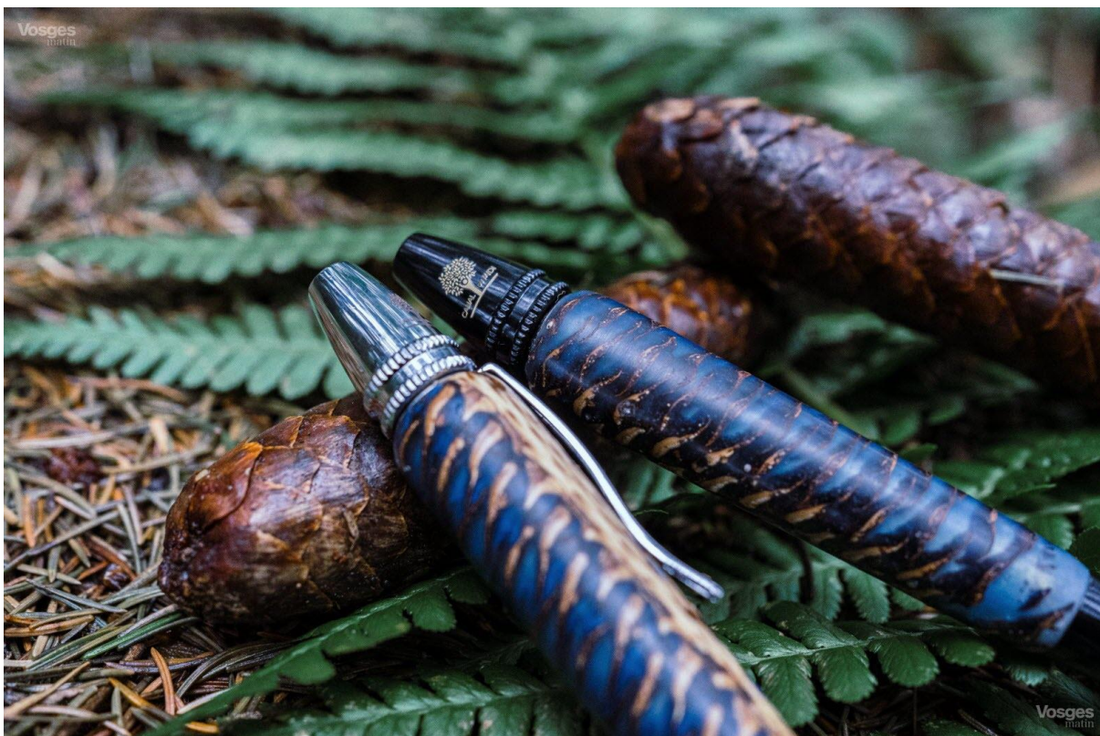
Une partie du prix de vente servira à financer la plantation de nouveaux platanes destinés à remplacer les 26 000 déjà abattus.