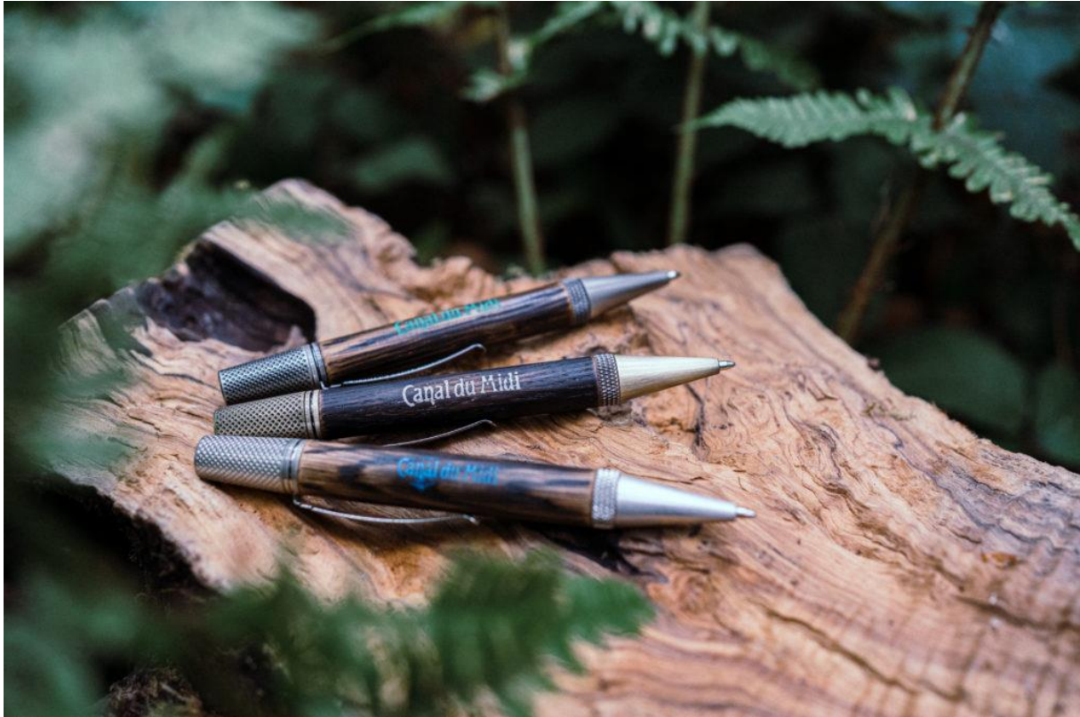
Le Naurouze

Au total, trente « Riquet » sont envisagés sur dix ans. Pour chaque stylo vendu, 15 % des ventes seront reversés au vaste projet de replantation du canal du Midi.