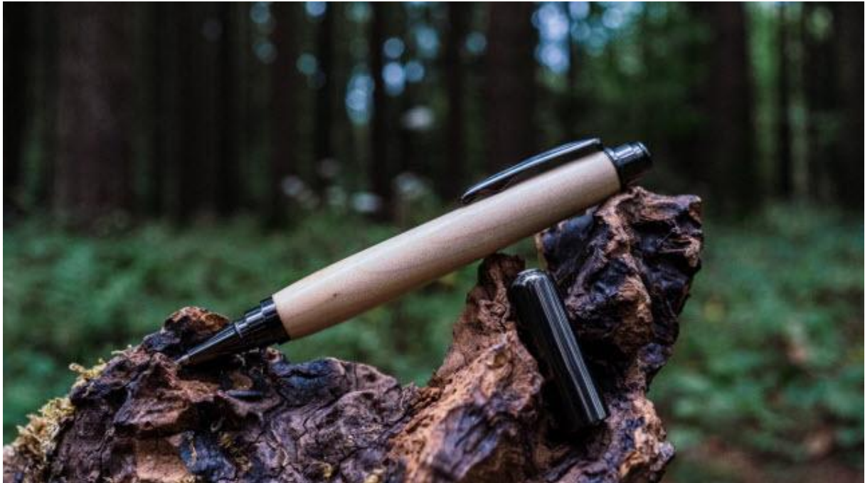
Chaque stylo Riquet fera référence à un lieu, un personnage ou un ouvrage d'art emblématiques du canal du Midi.