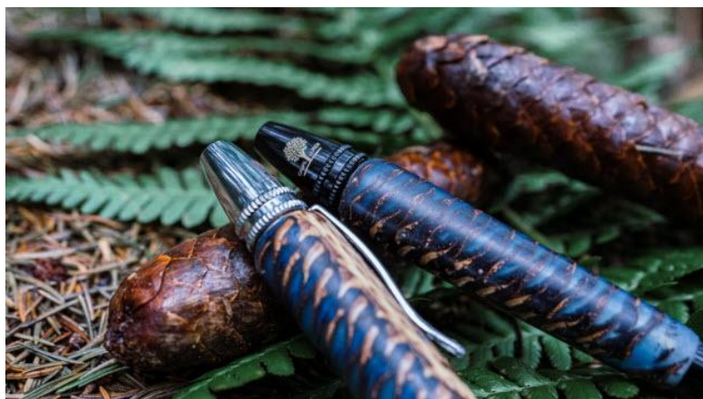
Une partie du prix de vente servira à financer la plantation de nouveaux platanes destinés à remplacer les 26 000 déjà abattus.