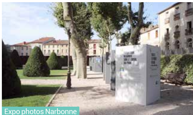
Expo photos Narbonne

Depuis le lancement de la campagne de mécénat de VNF auprès du grand public fin 2013 au profit du projet de replantation des berges du canal du Midi, 10 000 donateurs se sont mobilisés et une grande campagne de communication et de sensibilisation au projet a été mise en place par la Mission Mécénat de VNF sur le territoire national et régional. Au-delà des différents événements qui rythment l'année le long du canal du Midi, deux appels de fonds ont été lancés, un en juin auprès des donateurs fidélisés et un deuxième adressé en décembre auprès de 80 000 foyers en France.