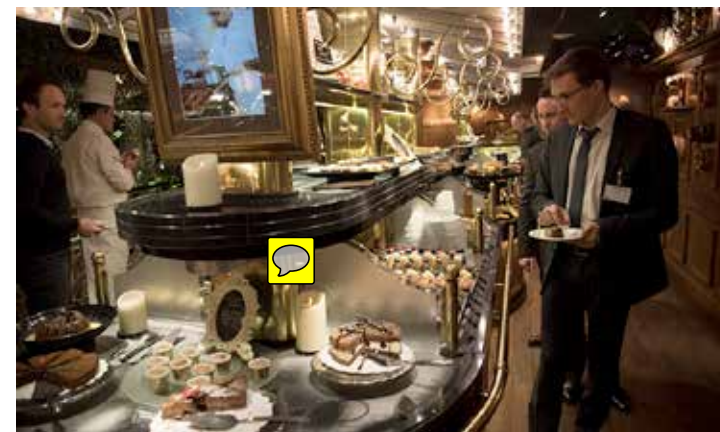
Grands Buffets Narbonne

Créé en 2013, le club des entreprises mécènes du canal du Midi rassemble en 2017 69 entreprises et vise à fédérer les acteurs économiques nationaux et régionaux, concernés par les enjeux environnementaux, patrimoniaux et culturels. Rejoindre le club des entreprises mécènes de VNF c'est appartenir à un réseau de décideurs impliqués dans la préservation d'un patrimoine mondial, symbole identitaire et levier de rayonnement du territoire. C'est aussi un moyen unique de valoriser la responsabilité sociétale et environnementale de l'entreprise en bénéficiant des retombées médiatiques liées à la promotion du programme. En interne, devenir mécène permet aussi de fédérer les collaborateurs autour d'un projet de proximité et à portée internationale, en renforçant leur fierté d'appartenance à une entreprise citoyenne et responsable.