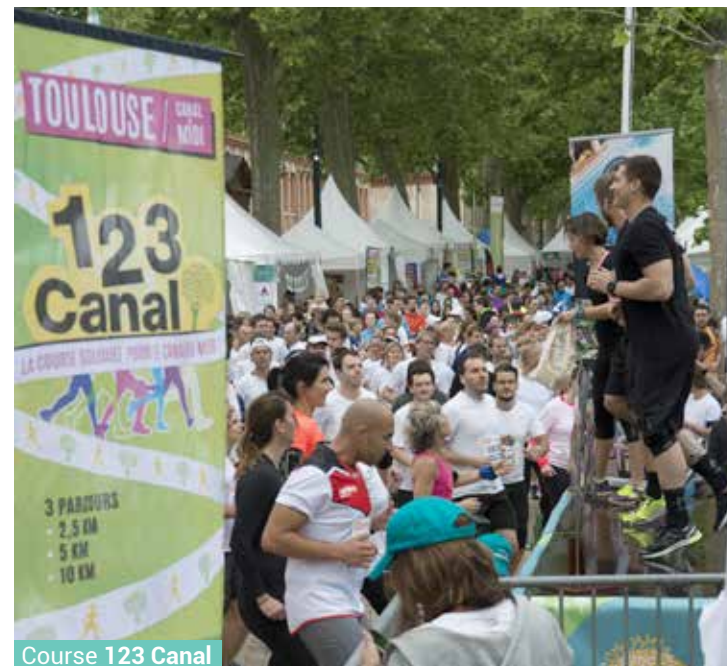
Course 123 Canal