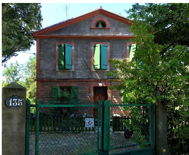
© Fondation du Patrimoine - Alexia Anfry

Depuis le 11 mai 2021, la Maison de l'Horloge, une ancienne maison d'éclusier propriété de VNF située à proximité des Ponts-Jumeaux à Toulouse, est devenue le nouveau siège de la Délégation Régionale Occitanie-Pyrénées de la Fondation du Patrimoine. Un site chargé de sens pour cette entité qui veillera désormais sur le patrimoine occitan depuis l'embouchure de l'emblématique canal du Midi, lui-même en cours de sauvegarde.